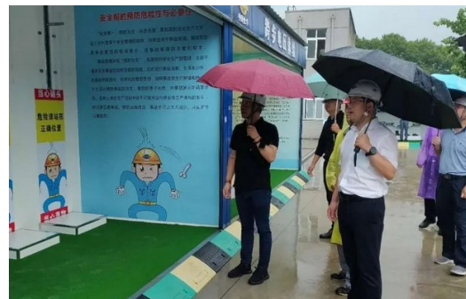
△宁波力勤矿业有限公司参观安培中心